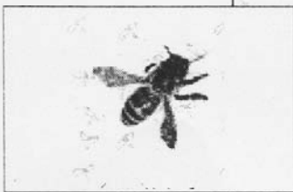
Die flügel-schlagende „animierte“ Biene ist dem Frommenhäuser Ortswappen entflohen

Teil drei unserer Serie Neues aus Rottenburg im Internet besucht die neue Homepage Frommenhausen. „Frumhusen“, so heißt es in der seit einigen Wochen abrufbaren online-Adresse, in Anspielung auf die urkundliche Ersterwähnung des Orts 1258. Begrüßt werden Besucher/innen auf der Homepage von der flügel-schlagenden „animierten“ Biene, die sich frech auf dem Geschriebenen niederläßt. Ein passendes Symbol, denn das Bienenlogo ist vom Ortswappen abgeleitet. Und auch sonst ist schön aufbereitete Abwechslung geboten. Aus privater Initiative ist die Homepage entstanden und bei der Erarbeitung des Inhalts kam von der Ortsverwaltung gute Unterstützung. „Frommenhausen im Internet“ versteht sich als Angebot, zu dem beizutragen alle EinwohnerInnen herzlich eingeladen sind.